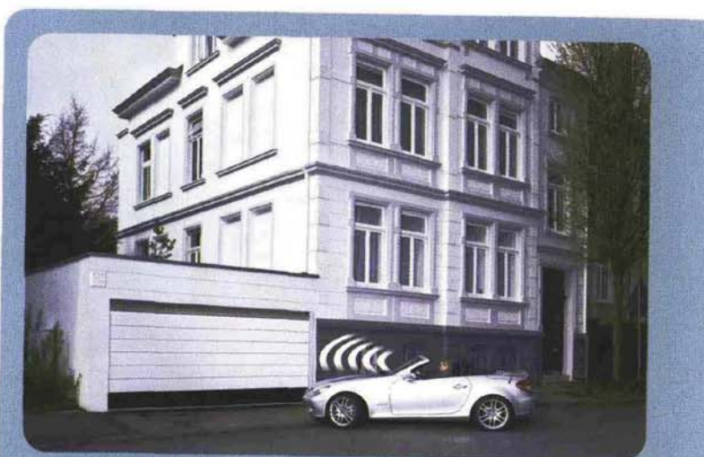
I portoni sezionali automatici possono essere aperti senza scendere dall'auto.

• È possibile adattare anche il look del portone da garage. Per i portoni in acciaio Hörmann presenta quattro diverse varianti: le grecature S (small), M (medium) e L (large) , nonché molteplici soluzioni a cassettoni. La grecatura L presenta un'ampia scelta di superfici, come la nuova ed elegante Micrograin in acciaio liscio con microprofilatura ondulata, in grado di creare giochi di luci e ombre in base all'incidenza della luce. I portoni sono disponibili in 15 colori allo stesso costo e, per un colore personalizzato, si può scegliere tra ben 200 colori della gamma RAL. Molteplici sono anche i portoni in legno massiccio di abete nordico e di conifera Hemlock, disponibili con grecatura, a cassettoni e in ulteriori otto modelli.